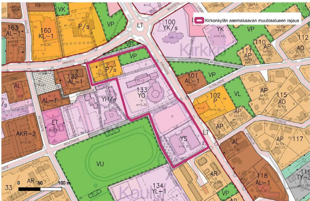
Kartta 1. Ote Tyrnävän ajantasa-asetuksesta. Asemakaavan muutosalue on rajattu punaisella viivalla.

OAS päivittyi asemakaavahankkeen edistyessä.