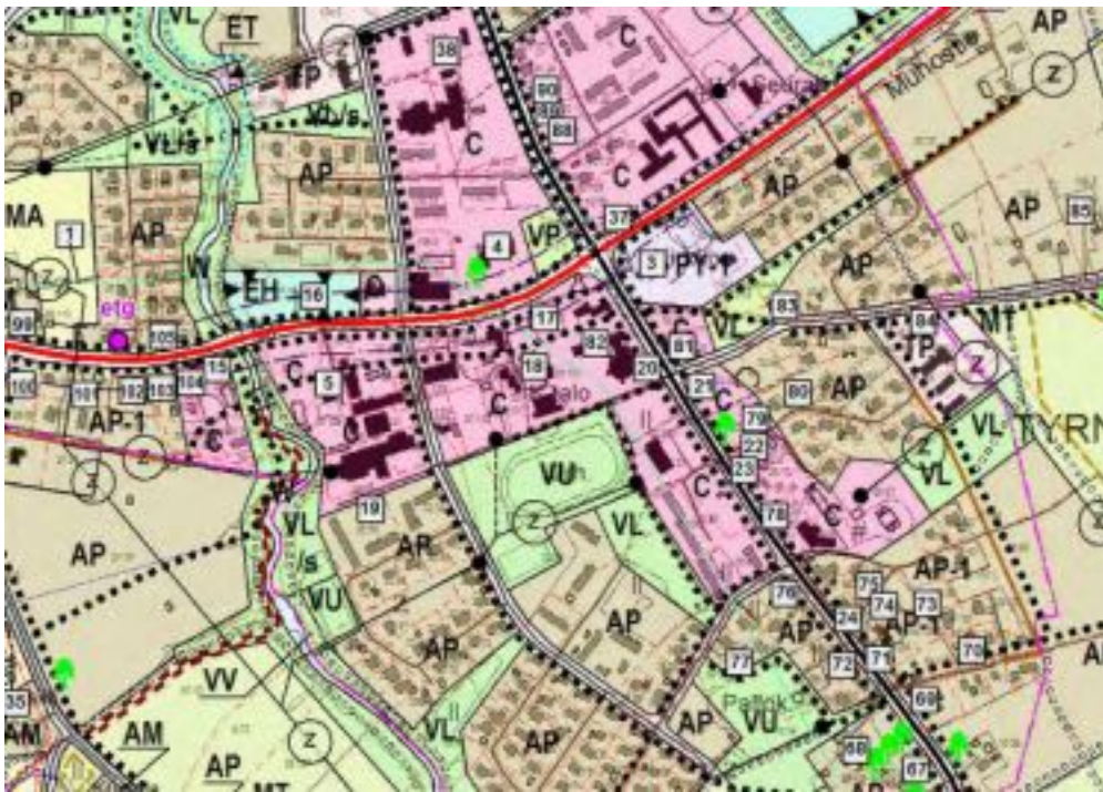
Kartta 2. Ote Tyrnävän kirkonseudun osayleiskaavasta 2005.

Osalla alueen rakennuksista on kulttuurihistoriallista arvoa. Kirkkomännikön koulu on arvioitu paikallisesti merkittäväksi kohteeksi ja Koivula seudullisesti merkittäväksi kohteeksi.