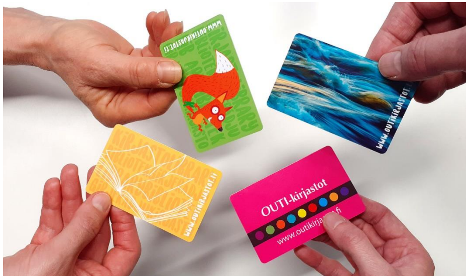
OUTI-kirjastoissa käytössä olevat kirjastokortit

Myös yhteisö, esimerkiksi päiväkotia, voi saada kirjastokortin. Yhteisön täytyy ilmoittaa kirjastoon yhteyshenkilö❓ Yhteyshenkilö on vastuussa kirjastokortista.